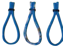
시료b(방서 사용) 시험 후

- 기존의 방서 캡슐(캡사이신)은 설치 작업시 손이나 눈을 다칠 수 있는 단점이 있었지만, 그 단점을 이중 실드로 해결